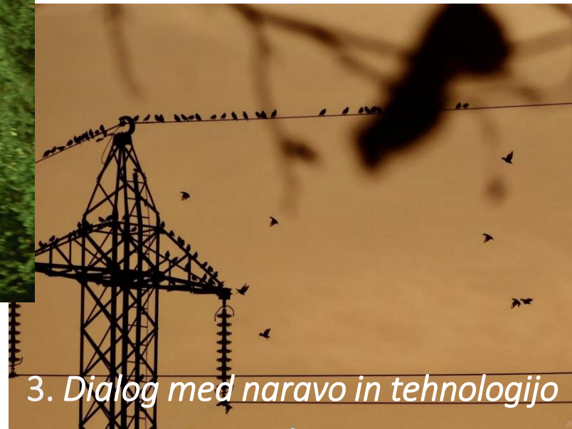
3. Dialog med naravo in tehnologijo