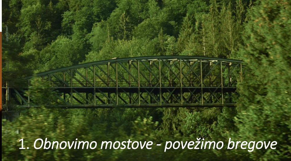
1. Obnovimo mostove - povežimo bregove