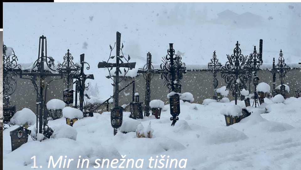
1. Mir in snežna tišina