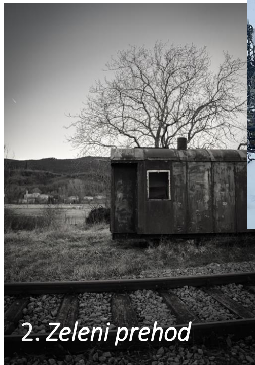
2. Zeleni prehod